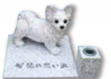
ペットのお墓も承ります